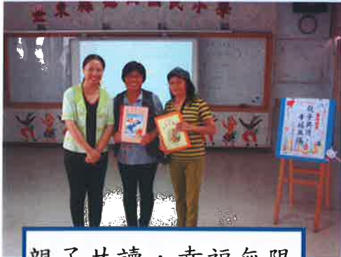
親子共讀，幸福無限