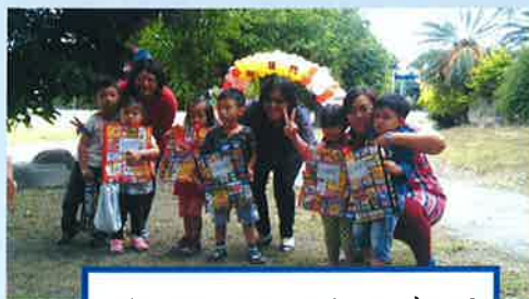
歡迎幼兒園小寶貝