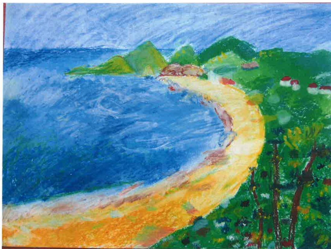
五甲 陳秀娟 -俯瞰岬灣