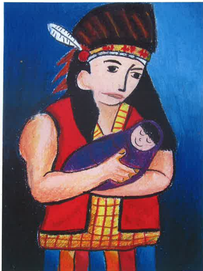
五甲 范景翔 -父與子