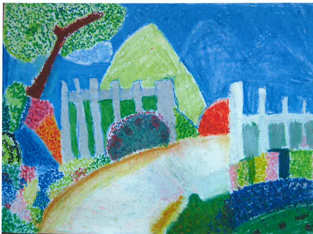
五甲 郭廷恩 -林蔭步道