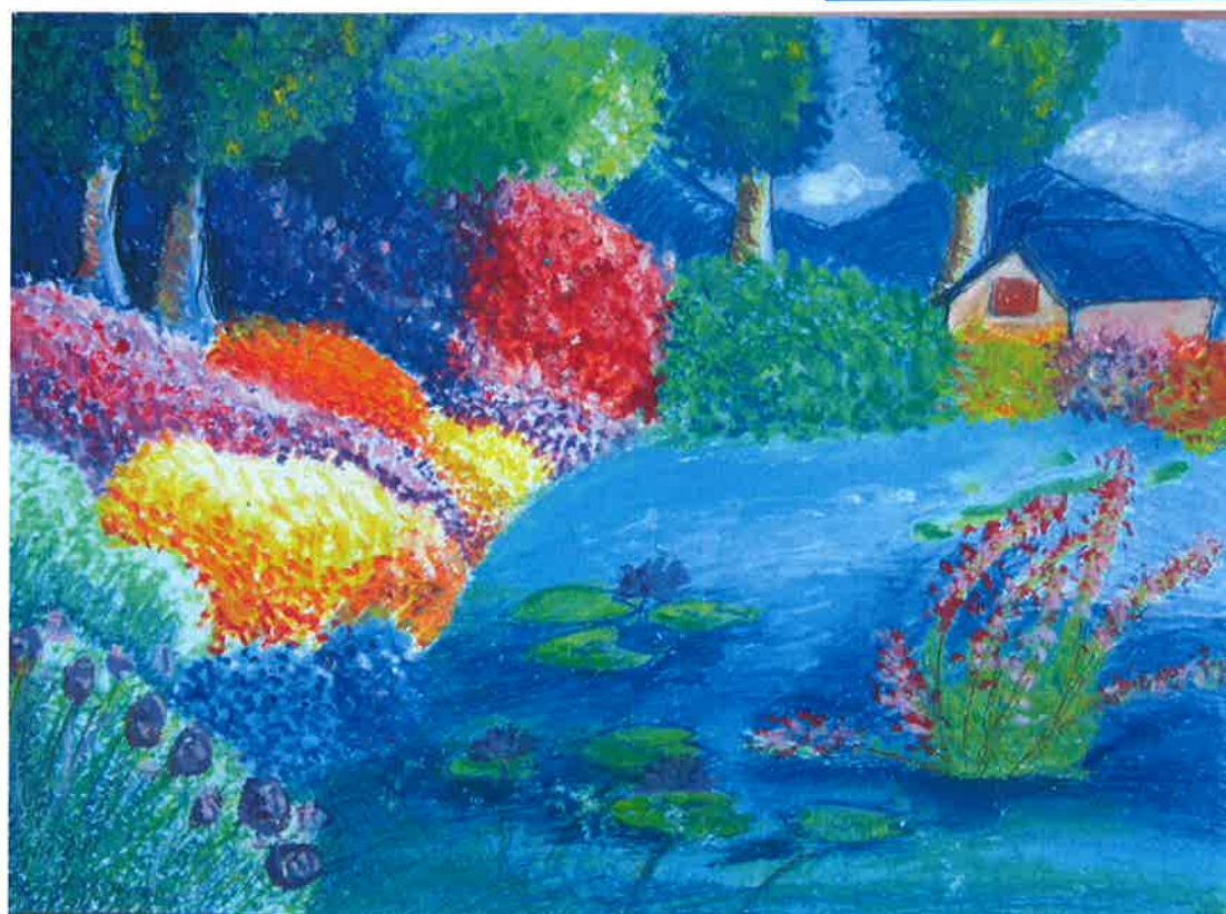
五甲 裴增欣 -後花園