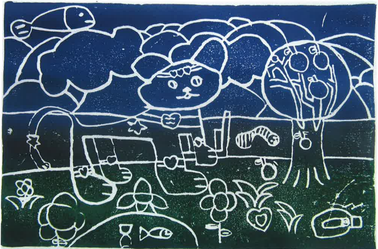
三甲 李嘉承 -我的奇幻貓