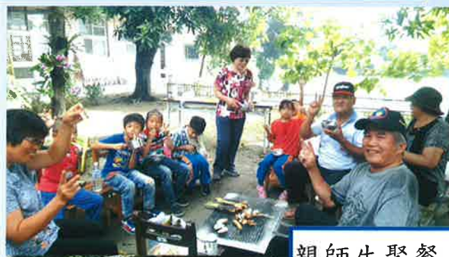
親師生聚餐，樂融融