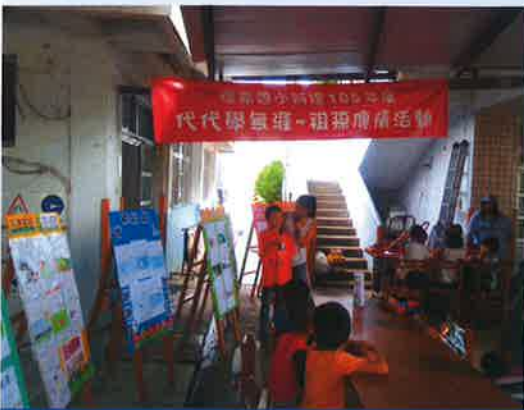
超人阿公、超人阿嬤，我愛您