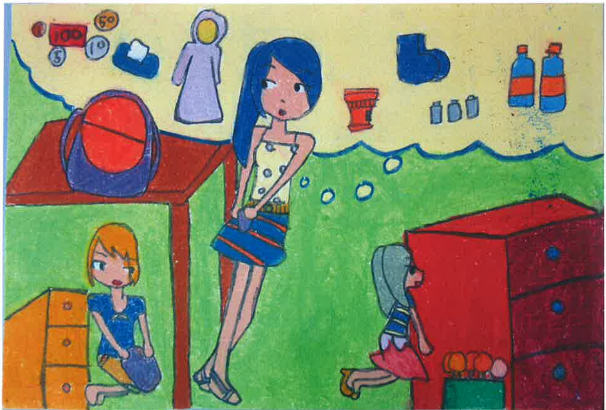
三甲 莊馨茹 -平时的防災準備