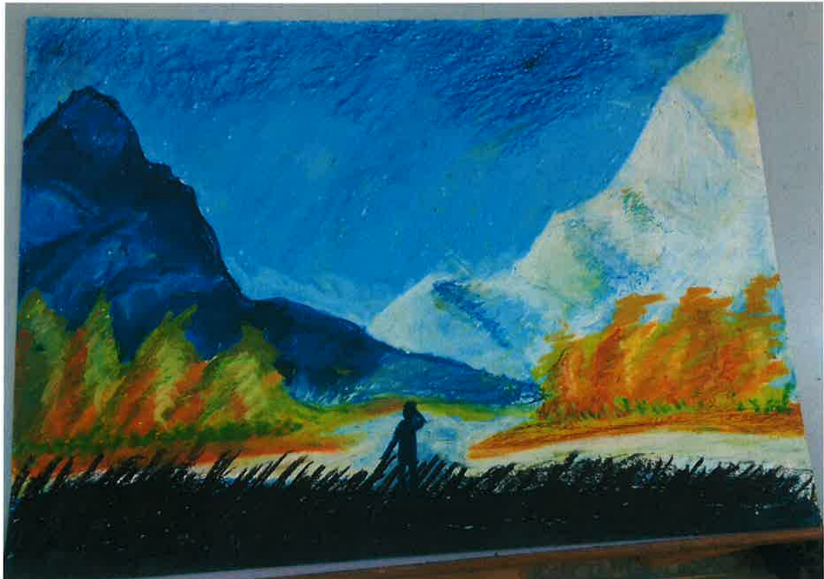
四甲 張韋傑 -望山